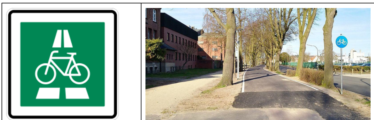
Abbildung 3: Zeichen 350.1 „Radschnellweg“ der deutschen StVO seit 2020 und Ende des ersten Bauabschnitts des "Radschnellwegs Osnabrück – Belm