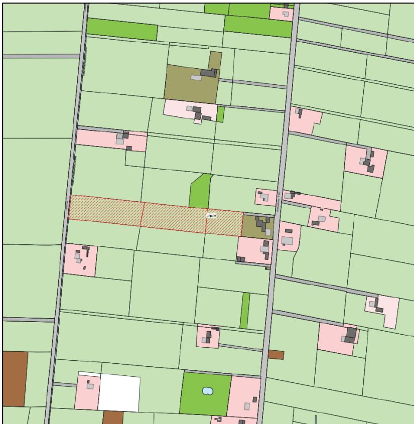
Abbildung 1: Übersicht zur Lage der Waldersatzfläche (Quelle: Begründung mit Umweltbericht zum Bebauungsplan Nr. 59 „Stindt-Flächen“ vom Planungsbüro Lux; bereitgestellt durch Gemeinde Jade).

Gemäß Hinweis der Niedersächsischen Landesforsten – Forstamt Neuenburg – ist der vorkommende Gehölzbestand auf den Flurstücken 43/1 und 43/13, der Flur 8 in der Gemarkung Jade als Wald i. S. des § 2 Abs. 3 des Niedersächsischen Gesetzes über den Wald und die Landschaftsordnung (NWaldLG) einzustufen. Demnach handelt es sich im Wesentlichen um einen sukzessiv entstandenen Laubmischwald aus verschiedenen Laubbaumarten wie Birke und Ahorn, vereinzelt Eiche und Eibe in den Wachstumsstadien Naturverjüngung bis mittlerem Baumholz. Der überplante Bereich hat eine Größe von rd. 0,1 ha. Gemäß vorliegender Stellungnahme des Forstamtes Neuenburg wird eine Kompensationshöhe von 1,1 als ausreichend erachtet, so dass eine Ersatzaufforstung zur Größe von 0,11 ha umzusetzen ist. Die Gemeinde Jade stellt für die Ersatzaufforstung die Flurstücke 658/270, 270/1 und 1004/270, der Flur 5, der Gemarkung Schweiburg zur Verfügung. Die Gesamtfläche beträgt rd. 17.205 m 2 , die bereits großflächig aufgeforstet wurde. Laut Aussage der Gemeinde Jade stehen auf den o. g. Flurstücken noch 4.626 Werteinheiten (entspricht einer Fläche 2.313 m 2 ) zur Verfügung, so dass der auszugleichende Wald hier vollständig kompensiert werden kann. Es verbleibt eine Fläche von 1.213 m 2 (entspricht 2.426 WE).