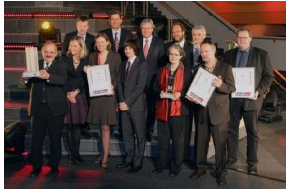
Foto: „Das Prinzip BürgerBus“ - 3. Platz NordWestAward 2009